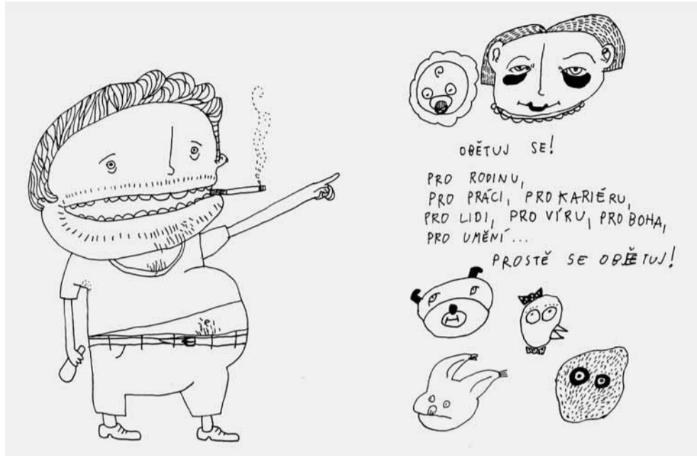
Na twitteru může pod podmínkou dodržení pravidel publikovat kdokoli. Kresba David Bohm

O tom, že se literatura dokáže zabydlet i v notoricky drsném prostředí twitteru – a to zdaleka nejen v případě nechvalně proslulých hoaxů o úmrtí velkých literátů, z nichž jeden před několika lety vylekal i čtenáře Milana Kundery –, se v první polovině minulé dekády mohli dočíst odběratelé téměř všech významných kulturních magazinů. The New Yorker psal o revolučním potenciálu twitteru pro literární inovaci, vychvalovala jej kanadská spisovatelka Margaret Atwoodová a do nadšených experimentů se zapojila i část českého literárního pole. Co přinesla diskuse z let 2009 až 2015 a překročilo nadšení z twitterové literatury svou expirační dobu?