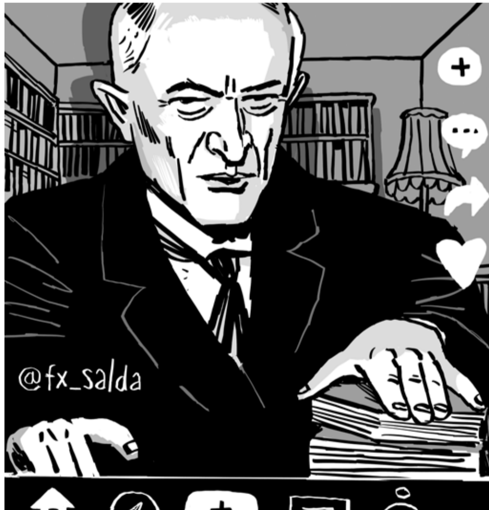
Ilustrace Alexey Klyuykov

ovšem pro nezasvěceného pozorovatele to nemusí být na první pohled zřejmé.