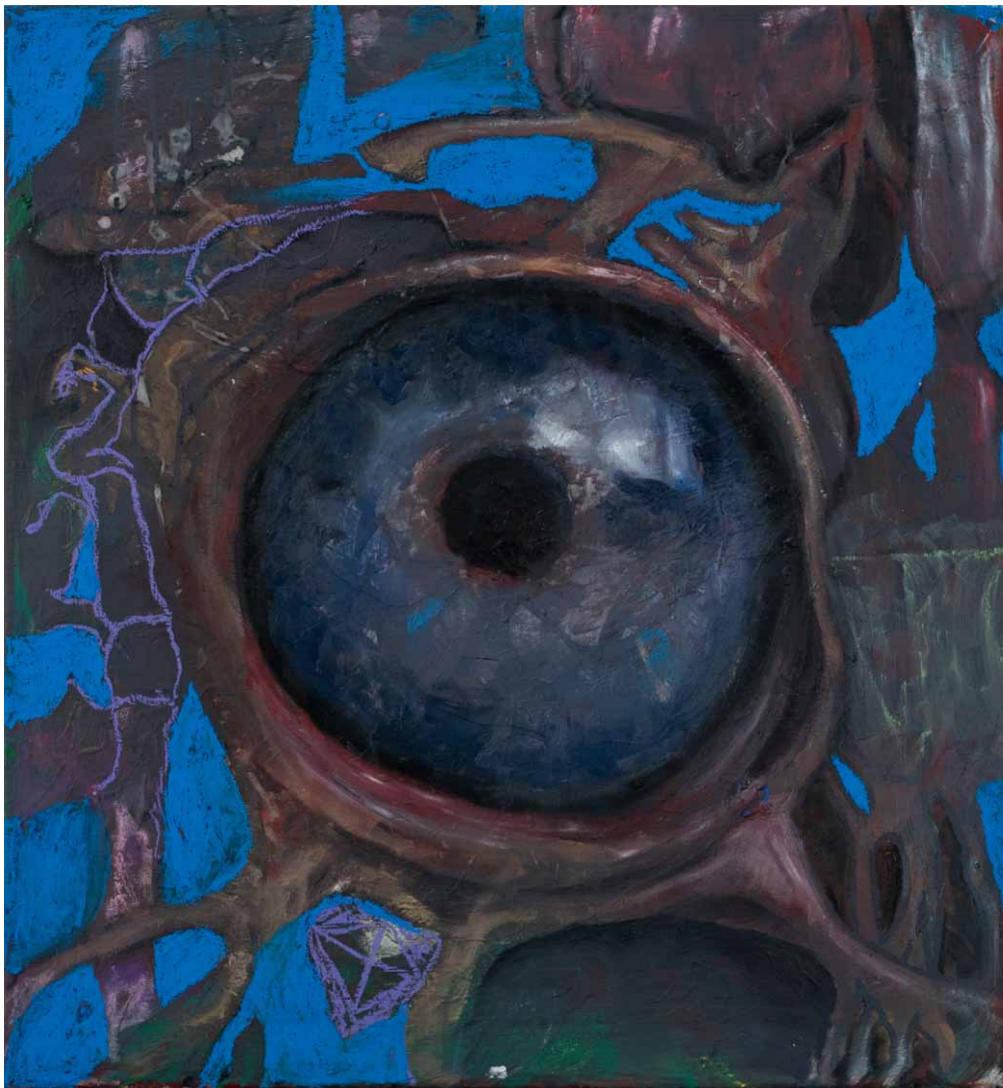
Lukáš Prudík: Angel's Egg, kombinovaná technika na plátně, 2022