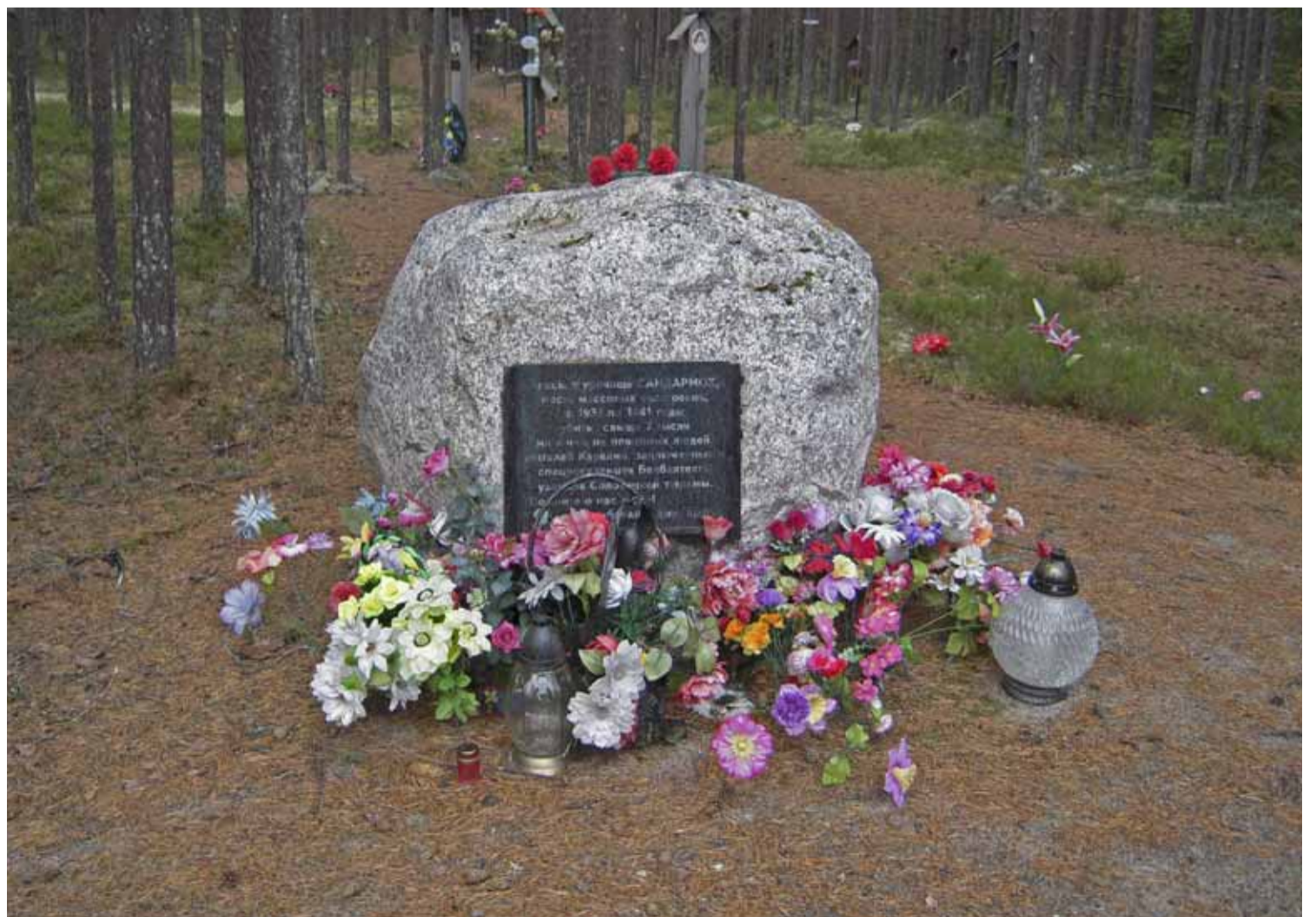
Památný kámen poblíž Sandarmohu, kde se v letech 1937–1938 konaly během Velkého teroru masové popravy.