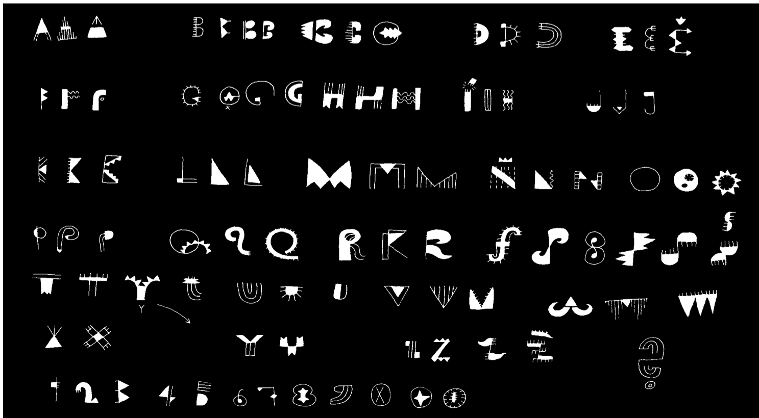
Instapoezie vychází vstříc všem, kteří chtějí číst poezii, ale někde se dozvěděli, že je příliš složitá. Kresba David Böhm

A když jsem míjel bílý pár s bílými motýly, pomyslel jsem na dnešní šťastné probuzení, na tři proplétající se možnosti, které se mi ráno tak zlehka nabídky. I na to, že není vlastně docela jisté, kterou z nich jsem nakonec zvolil, můj nádherný anděli!