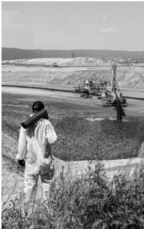
Klimakemp 2017.

Zda se podobného přijetí dočká i Extinction Rebellion, se těžko odhaduje. Podle Nováka má nicméně rozmanité české hnutí širší dopad na společnost – XR burcuje obyčejné lidi a snaží se oslovit společnost, kdežto Limity míří na viníky.