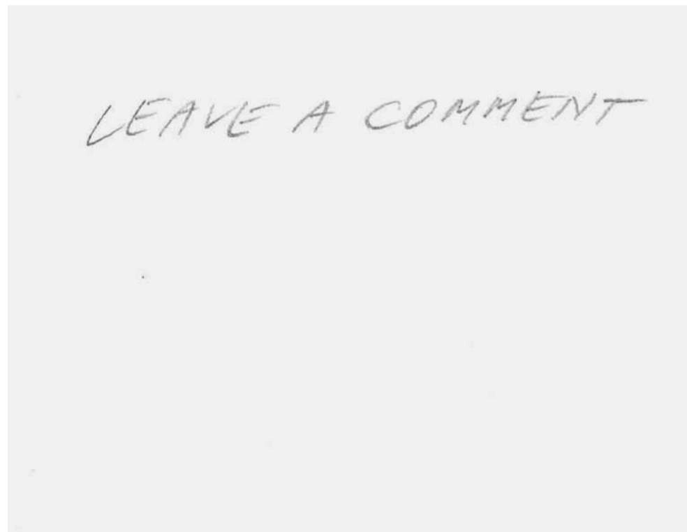
Někteří tvůrci se na instagramu rozepisují i v komentářích. Ilustrace Kristina Láníková

gram se pomalu zaplňoval selfies s knihami, amatérskými recenzemi, čtenářskými výzvami i krátkými videi. A knižní blogy začaly umírat.