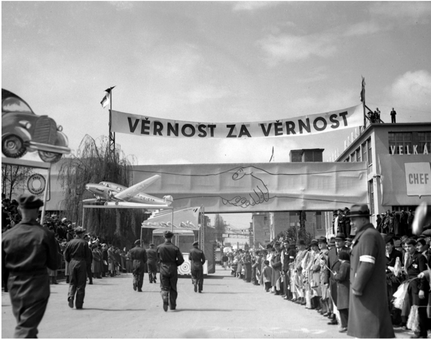
Význam Prvního máje je značně ambivalentní.