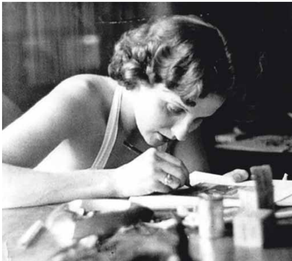
Alice Sheldonová alias James Tiptree, jr. alias Racoona Sheldonová.

James Tiptree, Jr., byl mužský pseudonym psycholožky a výtvarnice Alice Sheldonové, která spoludefinovala podobu science fiction sedmdesátých let. V její tvorbě, jež často dost vyhoceně řeší otázky genderu, se potkávají dobová témata s dodnes aktuálními myšlenkami.