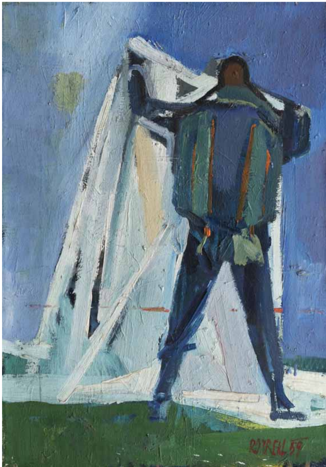
Teodor Rotrekl: Parašutista, 1959.

Tomáš Pospiszyl: Rotrekl. Kunsthalle Praha & Academia, Praha 2022, 336 stran.