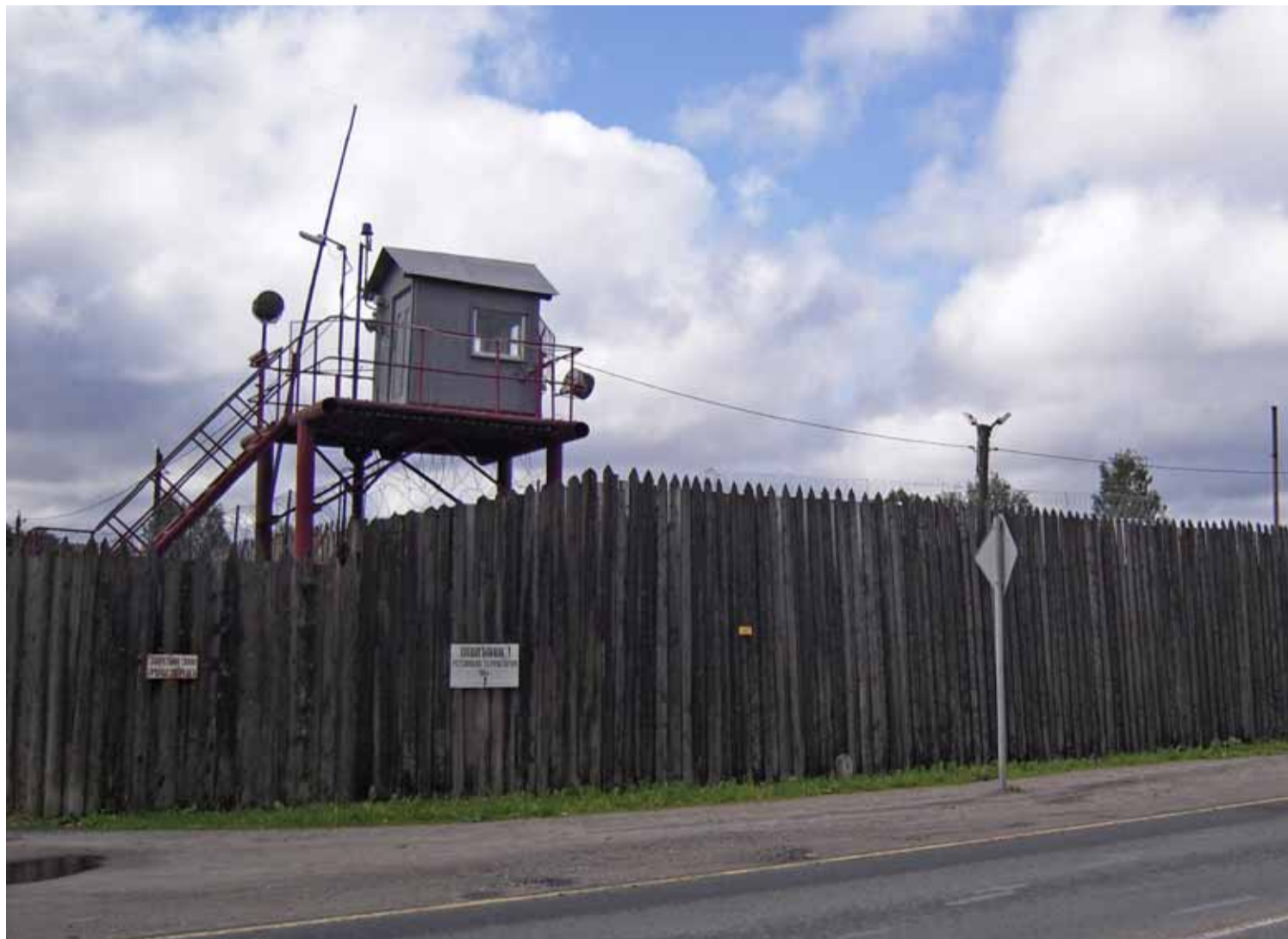
Strážní věž areálu nemocnice v karelském regionu, která ve třicátých letech 20. století sloužila pro vězně z tábora Belbatlag.

Jak moc se liší paměť míst na ruské periferii a v centru země? Jak se dnes taková paměť vytváří?