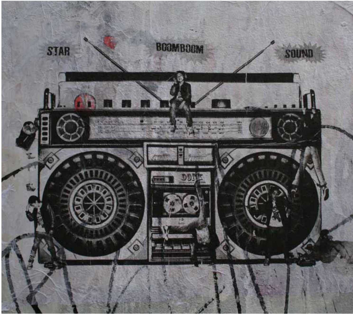
Donk: Behind the Old Blue Last.

si žádalo ticho. Jak vnější, tak i vnitřní. Navíc jsem si prostě a jednoduše nemohl zvyknout na to, že nemám možnost poslouchat hudbu na fyzických nosičích. Ničil mě nezvyklý elektronický formát. Po přirozeném zvuku, který se linul z pásky, se digitální formát zdál příliš pronikavý a ostrý jako mrazivý závan. Člověk si ale zvykne na všechno, zvláště když nemá na výběr. A já na výběr neměl, proto jsem se smířil s hudbou z telefonu, i s tou streamovanou. A co víc, v určité chvíli jsem si uvědomil, že AirPods a Spotify mi nahradily nejen analogový poslech, na který jsem byl zvyklý, ale i komunikaci, přátele, a dokonce všechno to umění, které mě obklopovalo před válkou. Literatura, malířství i film zmizely jako nemístné, rudimentární, a dokonce znepokojivé prvky minulého života. Hudba kupodivu zůstala. Stala se mou součástí, mou inspirací a stimulem, abych prožil ještě jeden den, mým kompasem v topografii nové hořké reality.