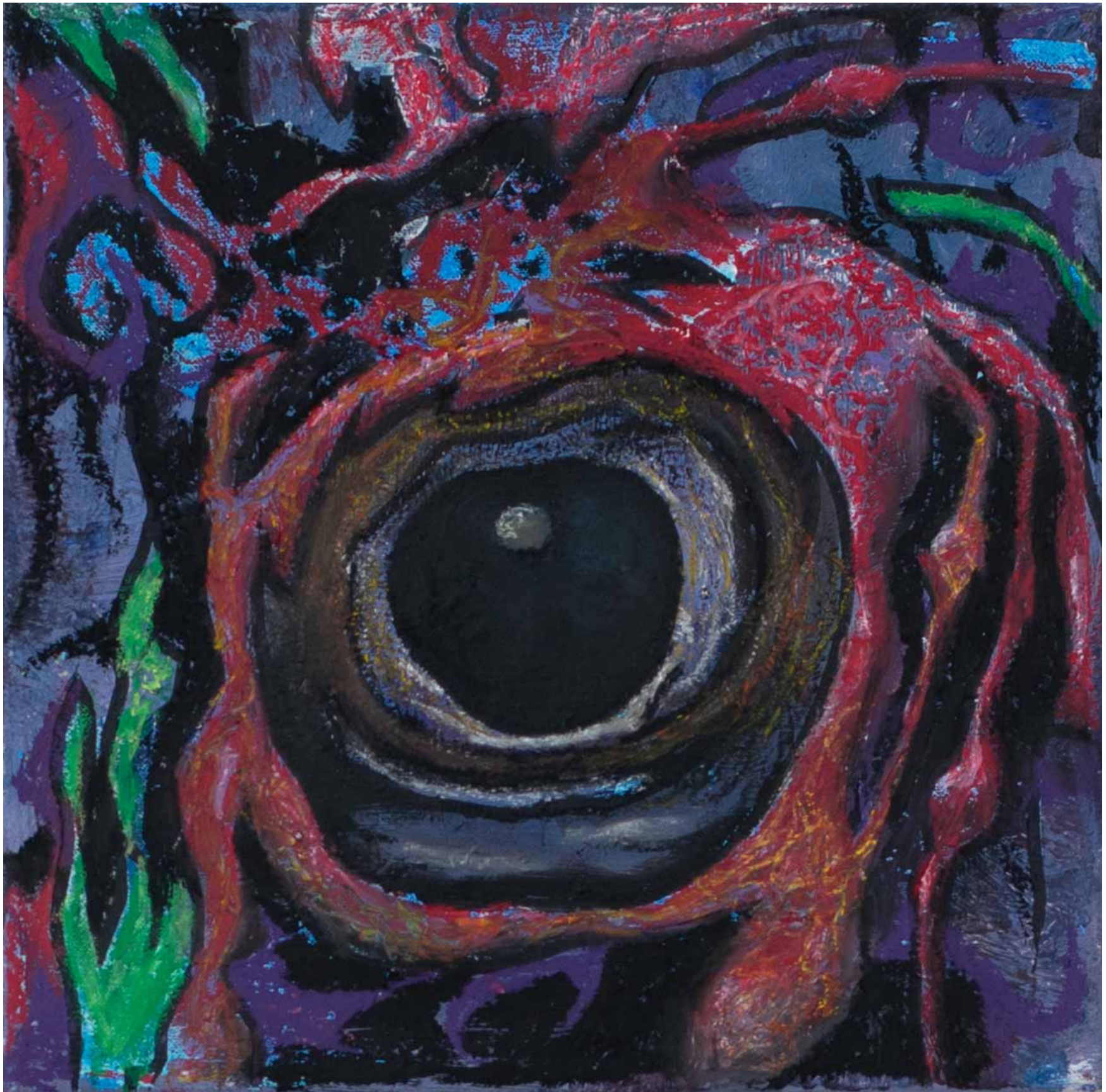
Lukáš Prudík: The Eye of The Arp 244, kombinovaná technika na plátně, 2022